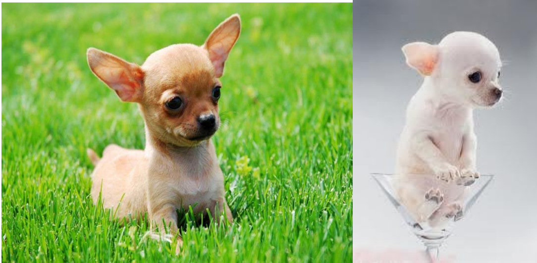
Hình 1.9. Giống chó Chihuahua

Giống chó này từ xa xưa đã được nuôi làm cảnh ở các cung đình và các gia đình quý tộc phong kiến Trung Quốc, ngày nay chó được nuôi làm cảnh ở hầu hết các nước trên thế giới.