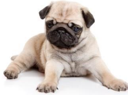
Hình 1.8. Giống chó Pug

Đây là giống chó nhỏ, vui nhộn, ngộ nghĩnh, rất thông minh hiền lành, lại yêu mến trẻ em. Người ta nuôi chó này làm cảnh vì chúng tốt bụng và thân thiện, dễ thích nghi với nơi ở mới, có óc khôi hài, dễ dạy và là con vật cưng lý tưởng cho mọi người ở mọi lứa tuổi.