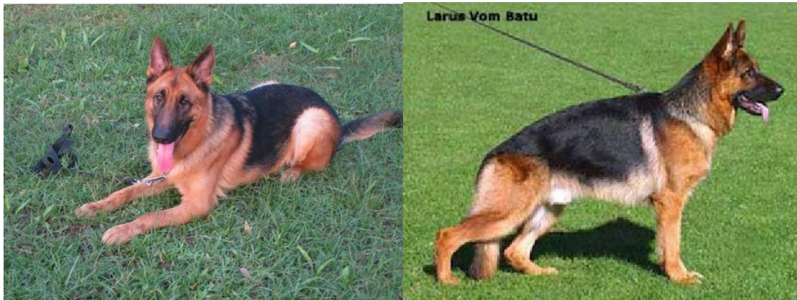
Hình 1.6. Giống chó Bergie Đức