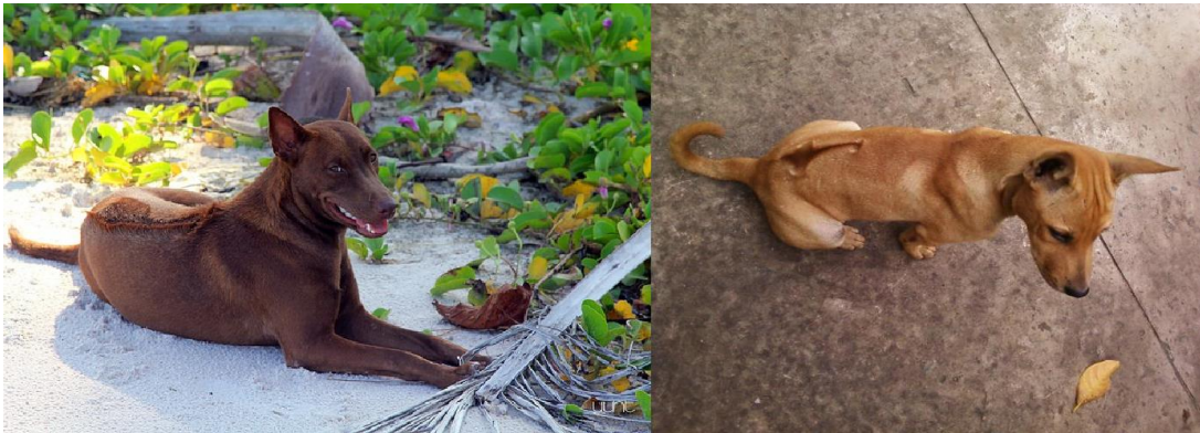
Hình 1.5. Chó Phú Quốc

Chó Phú Quốc rất trung thành với chủ, luôn tuân theo mọi mệnh lệnh của chủ. Trong các chuyến đi săn, nhiều con chó Phú Quốc đã liều mình cứu chủ thoát khỏi rắn độc cắn.