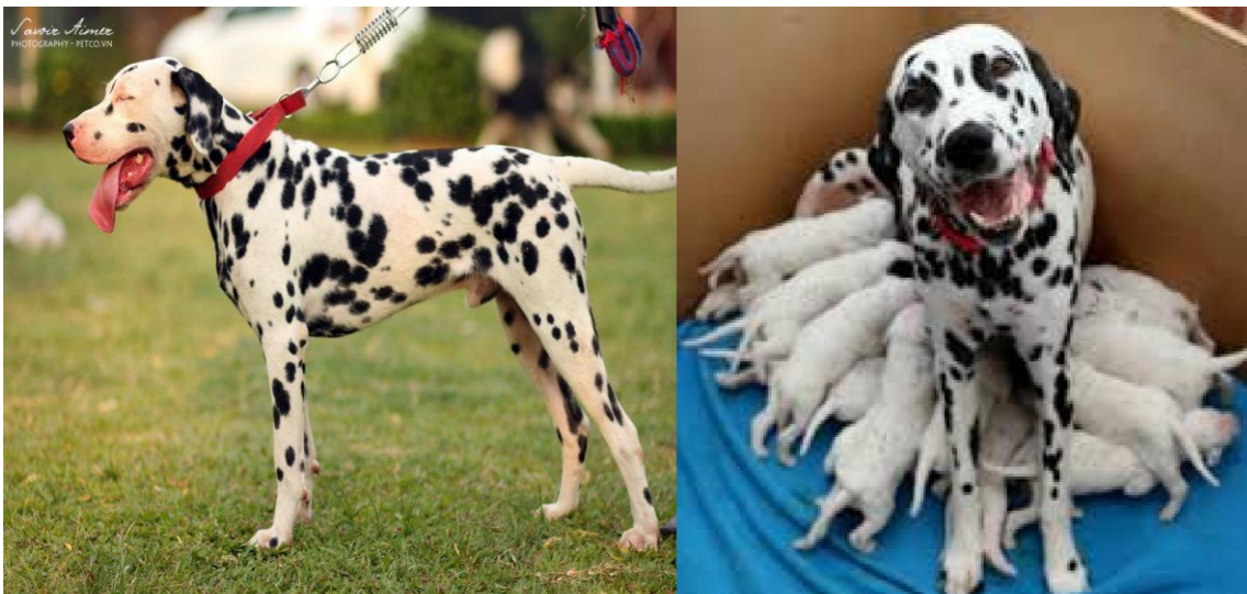
Hình 1.7. Giống chó Đốm

Chó đực có thể phối giống lúc 25-28 tháng tuổi, chó cái sinh sản khi được 20-22 tháng tuổi, mỗi lứa đẻ 5-10 con.