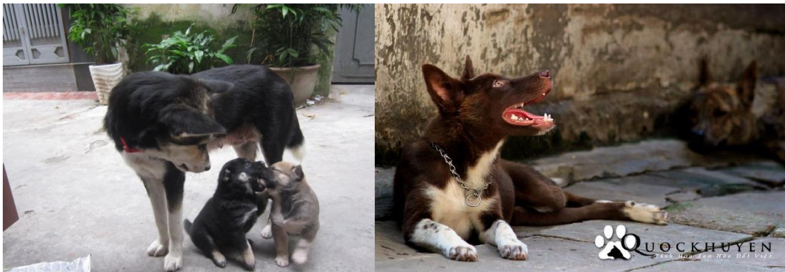
Hình 1.4. Dingo Đông Dương

Đây là giống chó nguyên thủy đặc trưng tại các vùng trung du và miền núi của Việt Nam. Hiện tại giống này đang được người dân vùng cao tại Việt Nam nuôi để săn bắt khắp các vùng lãnh thổ có những con sông lớn chảy qua. Chó Dingo tại Việt Nam chủ yếu được người dân nuôi trông nhà hay đi rừng... Đặc điểm dễ nhận biết với loài này nếu là thuần chủng phải có "4 chân đi bít tất trắng, đuôi bông lau và chóp đuôi trắng".