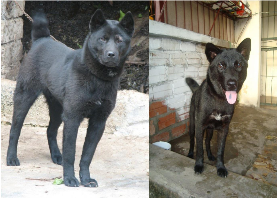
Hình 1.3. Chó H'mông