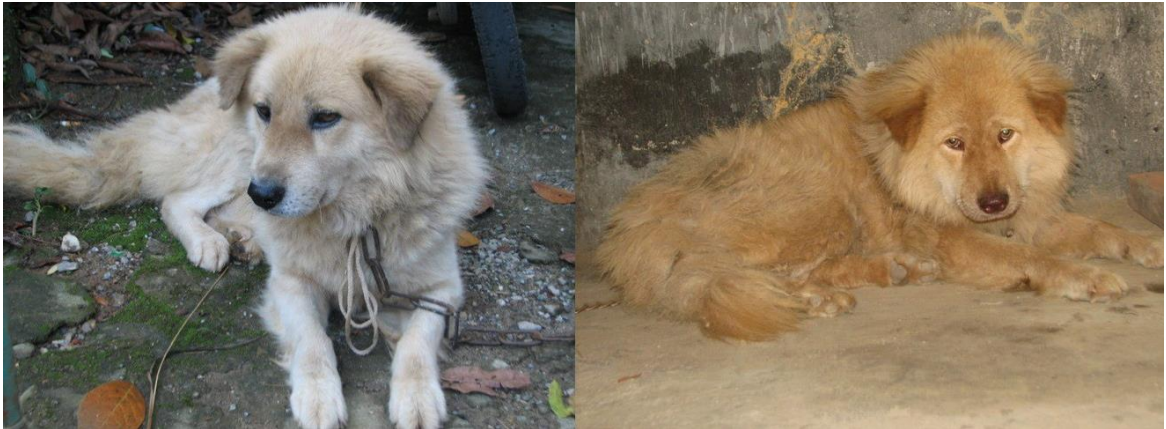
Hình 1.2. Chó Bắc Hà

Chó Bắc Hà là giống chó có kích thước trung bình, nặng 19-26kg với chó đực và từ 16- 23 kg với chó cái. Đôi tai chó Bắc Hà vểnh, đuôi xù (đuôi bông, dạng đuôi sóc) xoắn cuộn trên lưng hoặc buông thõng xuống quá kheo chân. Chó có lông cổ và vai dài tạo thành bờm cổ cách biệt với lông trên thân. Màu lông khác nhau như trắng, đen, vàng, vện, xám, khoang... Chó Bắc Hà là giống chó thông minh, ham huấn luyện, rất kỉ luật và thân thiện với các thành viên trong gia đình.